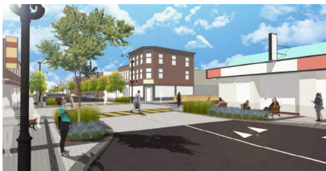
Vue de la future intersection Greene Tous les détails sur ladame.org

À compter du début du mois de décembre, le chantier prendra une pause « magasinage », histoire de redonner aux citoyens l'accès à leur artère commerciale à temps pour la période des Fêtes. Le chantier sera donc suspendu jusqu'au retour du beau temps, au printemps prochain. C'est à ce moment-là que la réelle transformation de la Dame aura lieu!