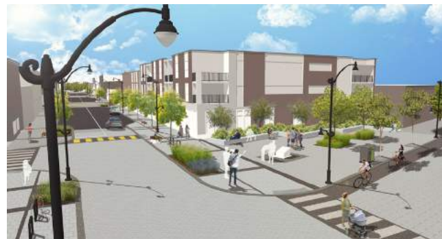
Vue du futur parc du Bonheur-d'Occasion. Tous les détails sur ladame.org